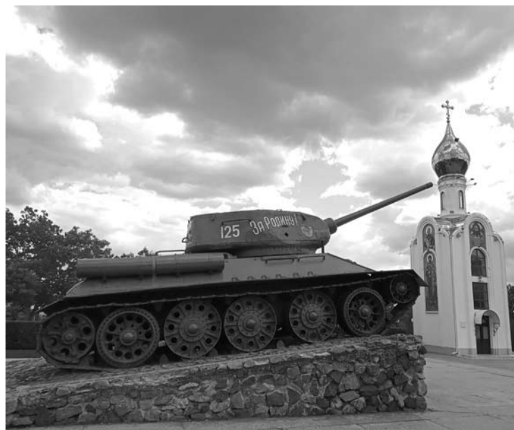
Tankas Tiraspolio centre, prie karių kapinių.

PMR teritorija yra unikali. Tai maždaug 200 kilometrų ilgio ir vos 6-38 kilometrų pločio žemės ruožas, esantis dešiniame Dniestro upės krante. Kairiame upės krante yra likusi Moldovos teritorija, o iš dešinės pusės PMR ribojasi su Ukraina.