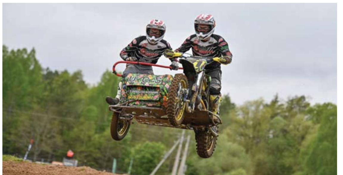
Atraktivos motociklų su priekabomis varžybos...