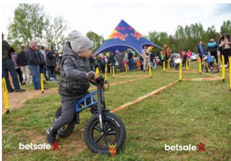
Viena iš papildomų atrakcijų - 3-5 metų vaikų lenktynės KTM balansiniais dviratukais.