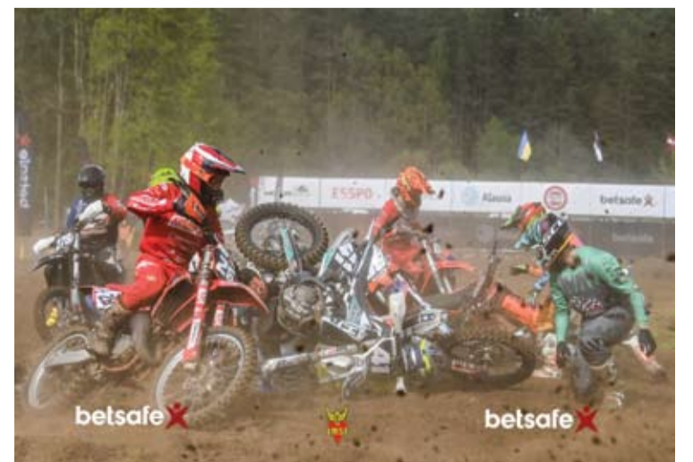
Varžybose netrūko ir sportinių incidentų.