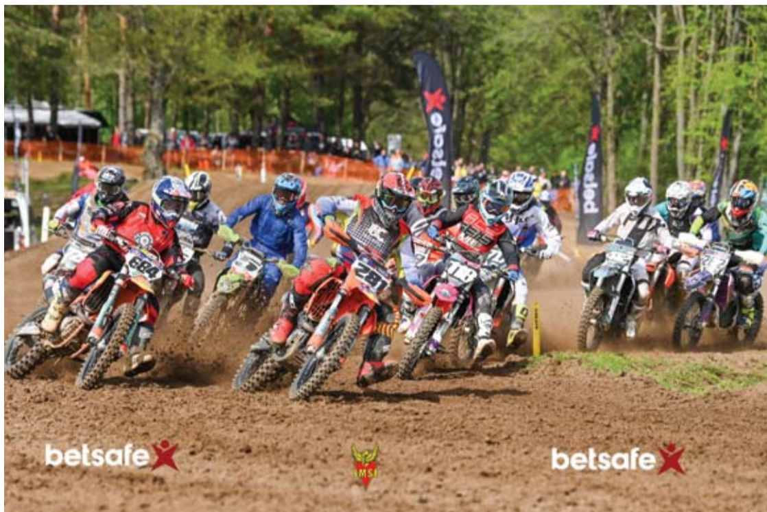
Motokroso varžybose Mickūnuose iš viso dalyvavo 258 sportininkai.